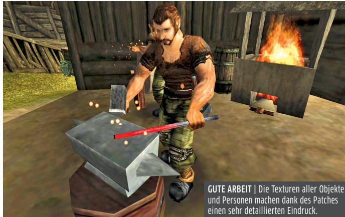
GUTE ARBEIT | Die Texturen aller Objekte und Personen machen dank des Patches einen sehr detaillierten Eindruck.