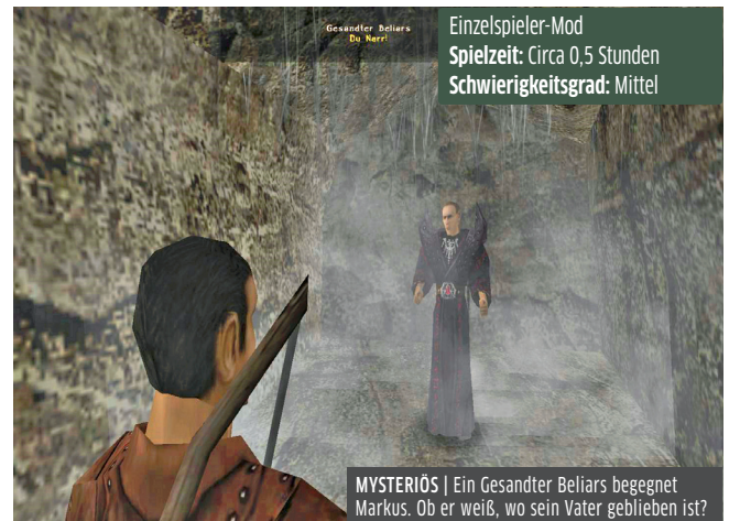
Einzelspieler-Mod Spielzeit: Circa 0,5 Stunden Schwierigkeitsgrad: Mittel