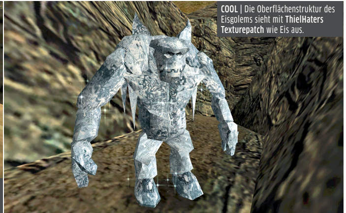
COOL | Die Oberflächenstruktur des Eisgolems sieht mit ThielHaters Texturepatch wie Eis aus.